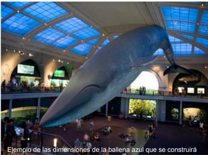
Ejemplo de las dimensiones de la ballena azul que se construirá