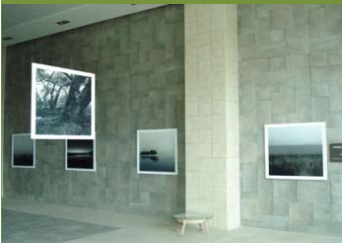
Prototipo de sala de exposiciones de WWF Chile

Todo realizado bajo un concepto de bajo costo de mantención y que resalte la conservación de la biodiversidad marina y la ballena azul, lo cual da viabilidad y permanencia a las exposiciones y muestras fotográficas (ejemplo de referencia, foto abajo) que pondremos a disposición a los visitantes.