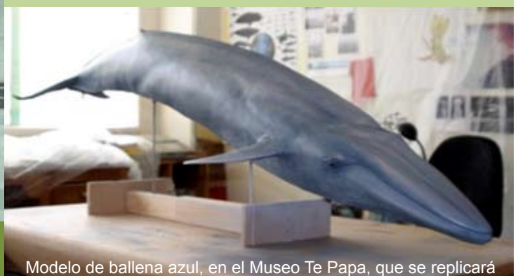
Modelo de ballena azul, en el Museo Te Papa, que se replicará